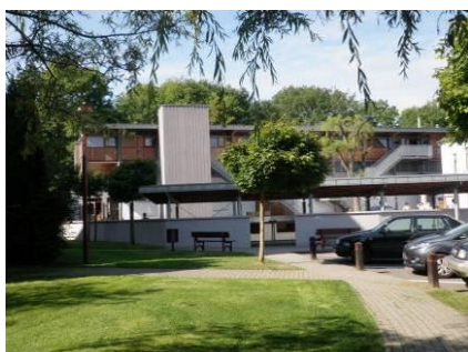
Implantation de Walhain Place communale, 2 010/65.83.16