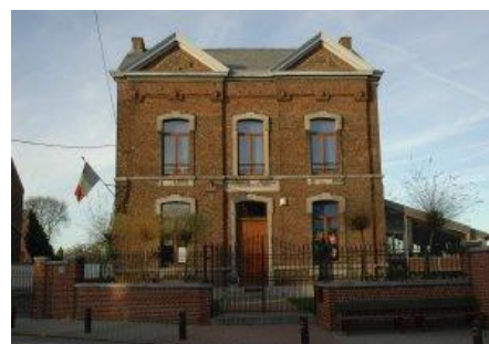
Implantation de Perbais Grand'Rue, 45 010/65.53.56