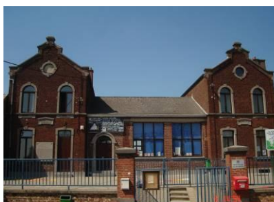
Implantation de Tourinnes Rue d'Enfer, 5-7 010/65.50.56